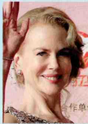
↑ ניקול קידמן