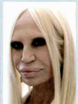
↑ דונטלה ורסאצ'ה