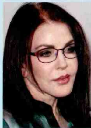
↑ פריסיליה פרסלי