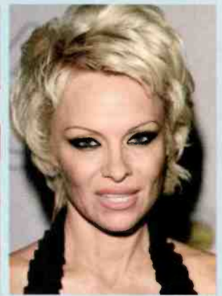
↑ פמלה אנדרסון