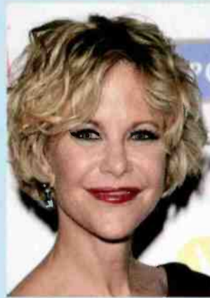
↑ מג ריאן