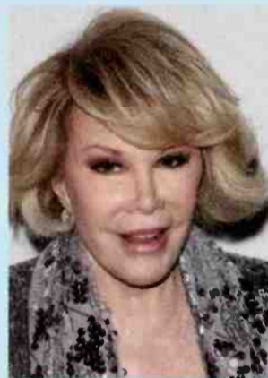
↑ ג'ואן ריברס