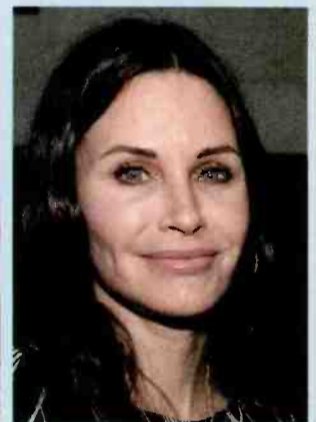
↑ קורטני קוקס