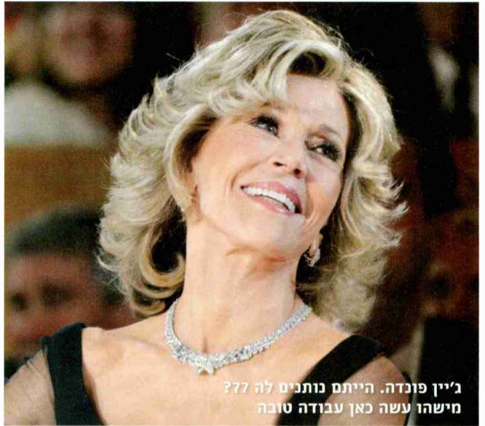
ג'יין פונדה. הייתם נותנים לה ?? מישהו עשה כאן עבודה טובה